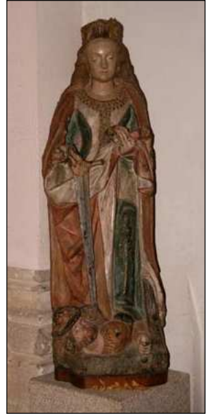
Sainte Catherine d'Alexandrie (XV e siècle, M.H.)