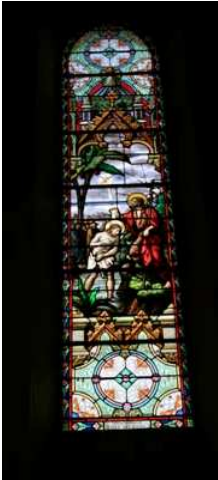
Baptême du Christ

Dans le chœur (auteur L.Koch, début XX e siècle), de gauche à droite :