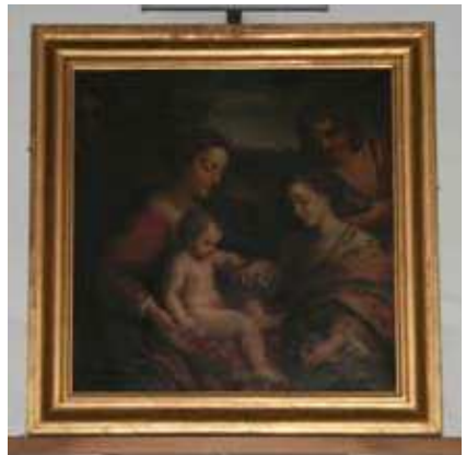
Tableau daté de 1881 et signé Sage. C'est une reproduction de l'œuvre célèbre de Corrège conservée au Louvre. Il provient d'un envoi de l'Etat en 1886.

* Au cours du XIX e siècle, une politique de mécénat accorde aux communes des œuvres d'art, en vue d'agrémenter leurs édifices.