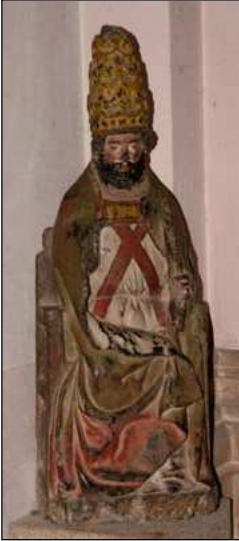
Saint Pierre pape (fin XV e siècle, M.H.)

Coiffé d'une haute tiare, il est assis sur un trône. Cette œuvre est en serpentine. La polychromie, bien qu'usée, est moderne. (manquent : le bras droit, la main gauche)