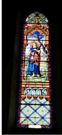
Sainte-Marie la Claire *