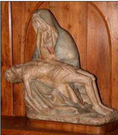
Vierge de pitié (début XV e siècle, M.H.) *