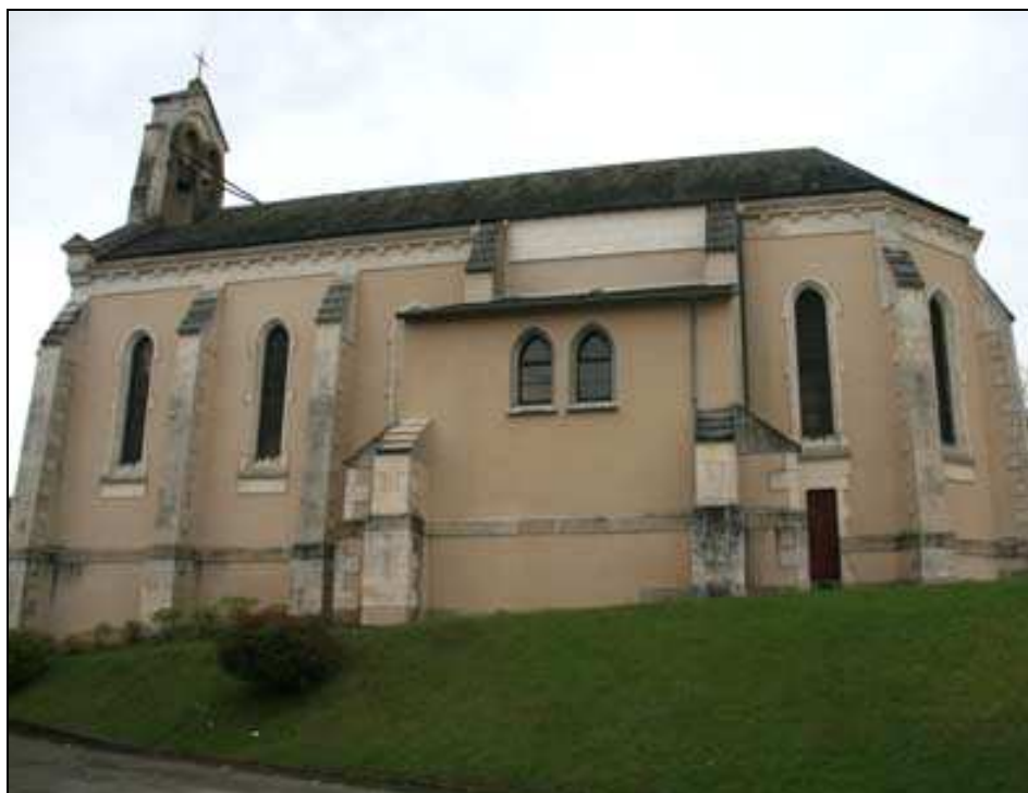
L'église vue de la Place de la Mairie